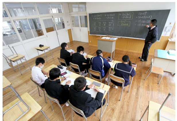
中高一貫教育校のため、連携クラスは超少人数で充実した英数の学習

確かに、本校にも不登校や相談室登校その他の問題行動が存在します。授業に集中できない生徒がいたり、宿題忘れ常習者がいたりするなど、手のかかる生徒もおります。問題がないわけではありません。本校も普通の学校ということなのです。