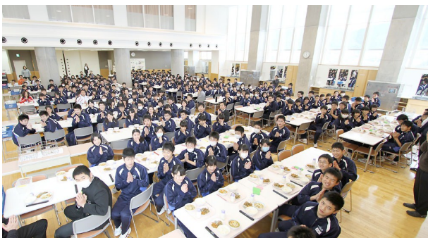
全生徒、職員がランチルームで楽しく給食

また、廊下を歩いていると、気持ちのよいあいさつが響きます。あいさつは、教師の方から積極的に声をかけるのが本校流です。