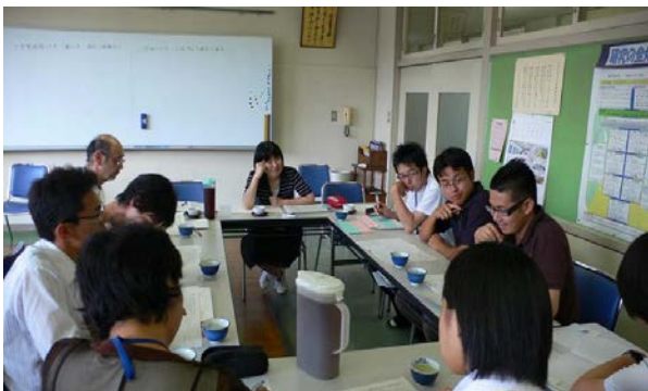
<連携協力校で授業をめぐる自発的に話し合うコミュニティ形成>

岐阜大学教職大学院は平成23年度をもって4年目を迎える。これまでの紆余曲折、試行錯誤の歩みを振り返り、その特色というか社会的に発信する意味があると思えるものは何かと言ったら、やはり従来の大学院の「修士論文」に代わるものとして設けた「開発実践報告」ではないかと