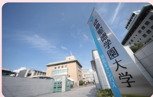
岐阜聖徳学園大学