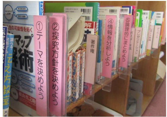
写真・図書室の様子

解決するべく、図書部が主体となり地域に関するコーナーを新設した。また、その一角には探究学習に関する書籍など、探究学習に携わる教員のためのスペースも作られていた。生徒だけでなく、教員が利用できる学びの環境を整備する必要性を強く感じた。