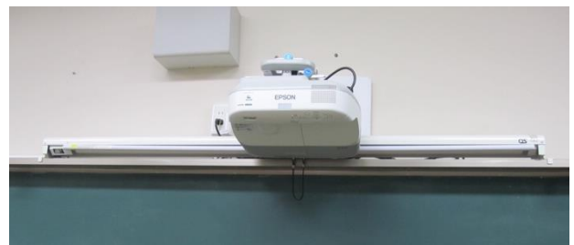
各教室に設置されたプロジェクターとスクリーン

林野高校では、MDPだけでなく、各教科の普通の授業から協同学習を取り入れている。その準備として、次の2つ取り組みが特に印象的であった。1つめは教室のICT機器の充実である。林野高校では全ての普通教室に短焦点プロジェクターを整備している（平成24年度～）。これにより、機材準備にかかる時間・負担を大幅に軽減し、各教員が気軽にICTを活用することができている。ICTを使うことで、教員からの板書や説明にかかる時間は短縮され、その浮いた時間を生徒同士の話し合いなどの時間に費やしている。