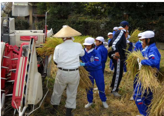
5年米づくり（稲刈りの様子）

今年度の本校の研究主題は、「進んで伝え合い学び合う子の育成 ～読解力・活用力を高め、より適切に伝える力を育てる～」です。研究主題「進んで伝え合い学び合う子の育成」は昨年度と同じですが、今年度は、県教委の「コア・ティーチャー養成事業」を受け、PISA型読解力の向上をめざして、国語の授業研究に取り組んでいます。「コア・ティーチャー養成事業」にからみ、全校研を年間5回実施します。全校研を行わない教員も指導主事訪問での公開授業を行います。県指導主事の月1回の学校訪問もあるので、授業研究会や現職教育が国語一色になりますが、この機会をチャンスとして捉え、授業実践力の向上、授業での児童の様子の見取りのスキルアップ、事後研究会の活性化など、継続した取り組みを行っています。さらに、「地域と連携した活動」と「コア・ティーチャー養成事業」を絡め合わせながら、双方向的な地域と連携した活動をめざし、児童も授業に関係した全ての地域の方々も満足することができる、学習の展開についてチャレンジしています。