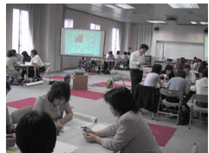
特別支援教育コーディネーター研修