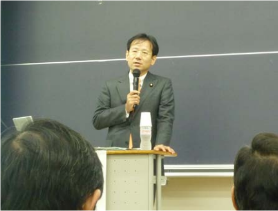
鈴木寛文部科学副大臣